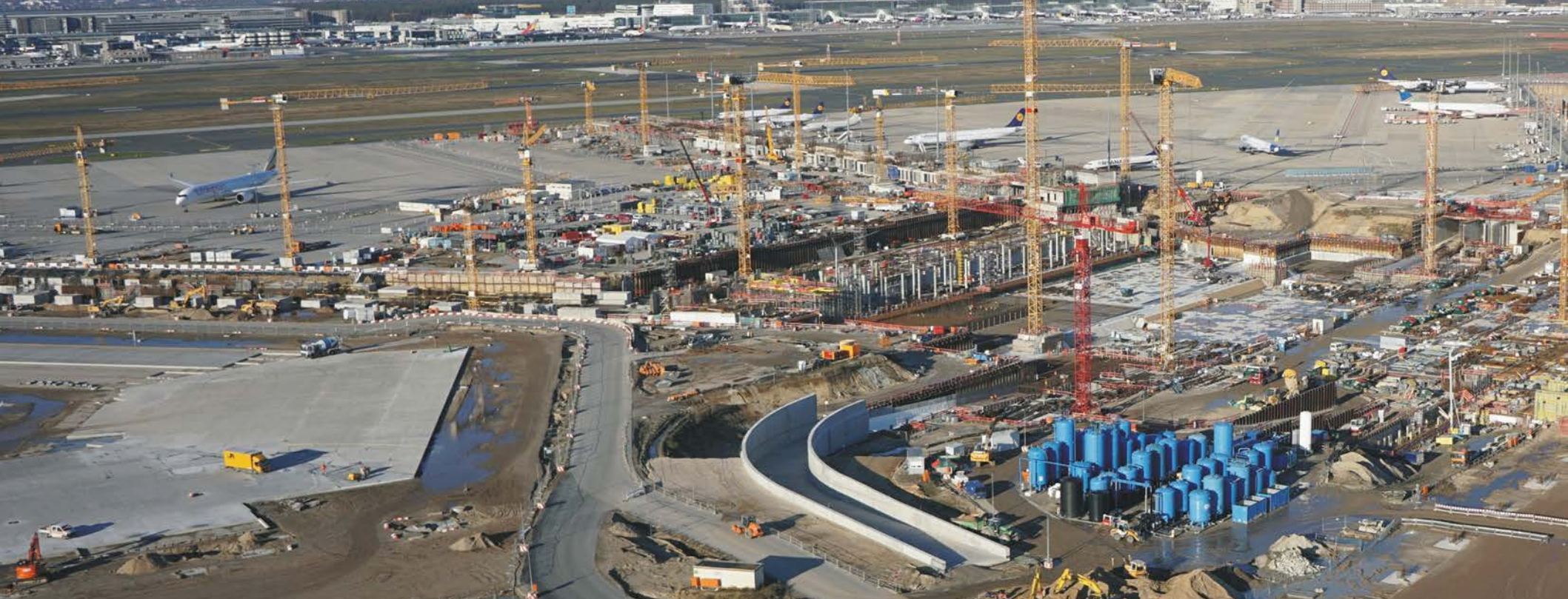
Terminal 3 Frankfurt Flughafen, Deutschland